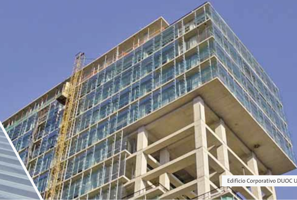
Edificio Corporativo DUOC UC